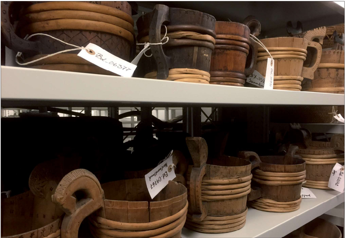
Figur 4. Bygdesamlingen flyttes nå over til moderne og sikre fjellmagasin.